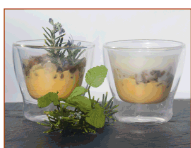
Textures de tardor (crema de moniatos escalivats, bolets i castanyes amb velouté de gallina) Font Moixina