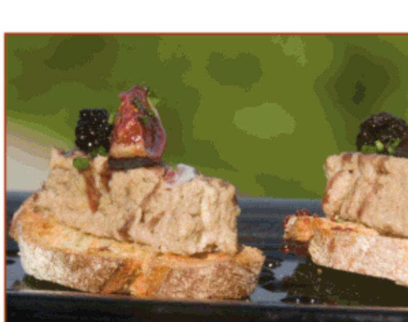
Paté de senglar guisat, mores confitades de l'Alta Garrotxa i reducció del mateix vi Can Suru