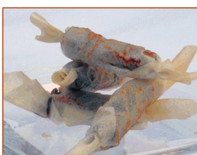
Caramel de brick amb ceba confitada i carn de perol L'Alba