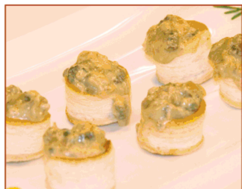
Vol-au-vent de bolets i foie Cal Parent