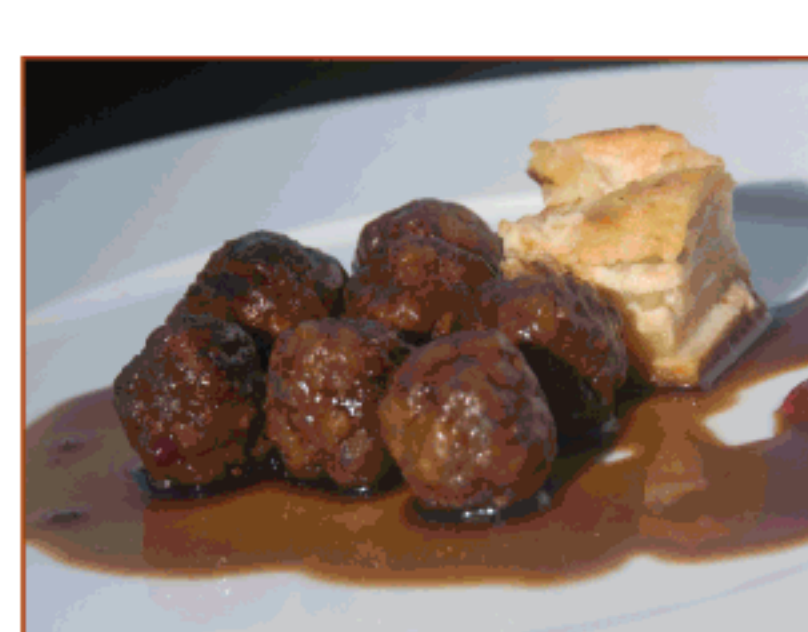
Pilotilles de senglar amb melmelada de figues i dauphinoise de patates La Francesa