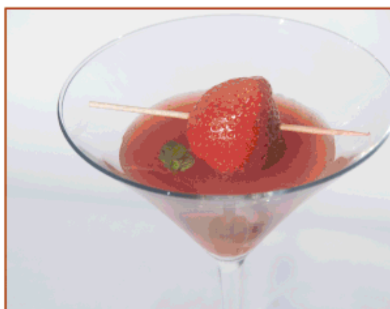
Liquat de maduixots amb vermut i pebre rosa Bar Sa Dragonera

Dimecres 24 de novembre de 2010 a les 21.00h al restaurant La Deu d'Olot