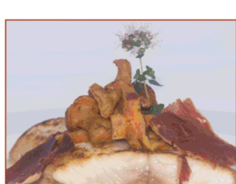
Suprema de llobarro salvatge amb crema de moniato, saltejat de bolets i cruixent de pernil d'aglà. La Deu