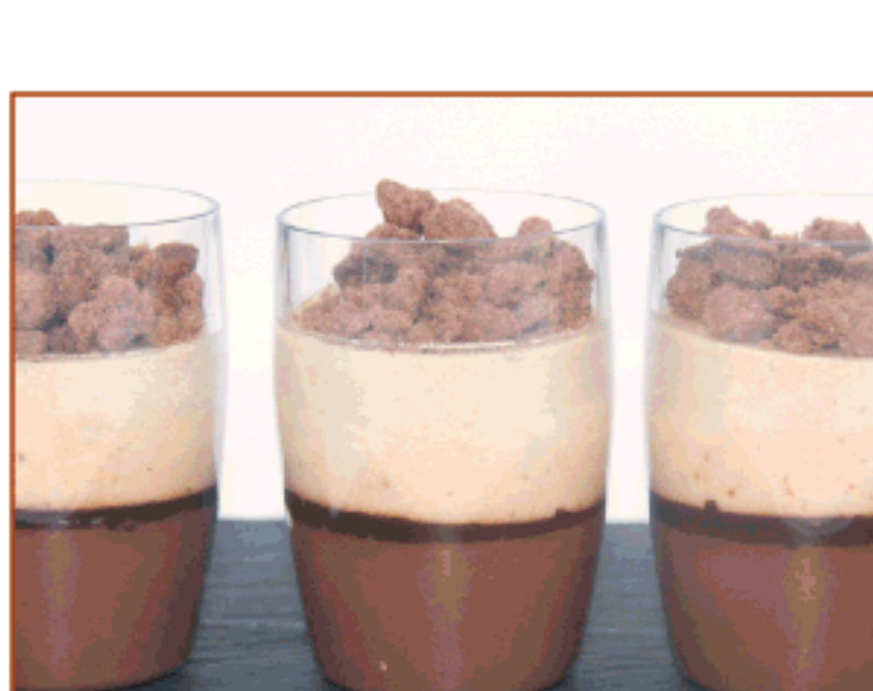
Quallada de ratafia Russet i xocolata amb castanya i cacau La Nevateria Sweets & Coffee