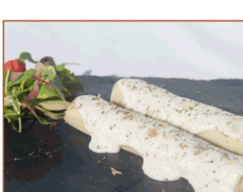
Caneló farcit de botifarra i bolets amb beixamel de tòfona d'hivern Cal Sastre