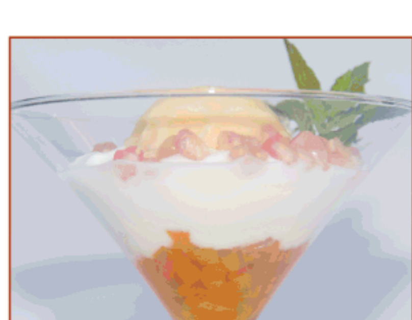
Sopeta de iogurt de La Fageda amb sorbet de carbassa Self-Service La Garrotxa