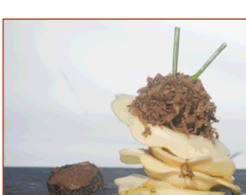
Ravioli de mató i pera llimonera amb tòfona d'hivern Can Xel