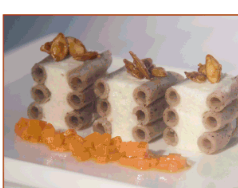
Terrina de macarrons de Fajol, brandada de bacallà i oli de carbassa Hostal dels Ossos