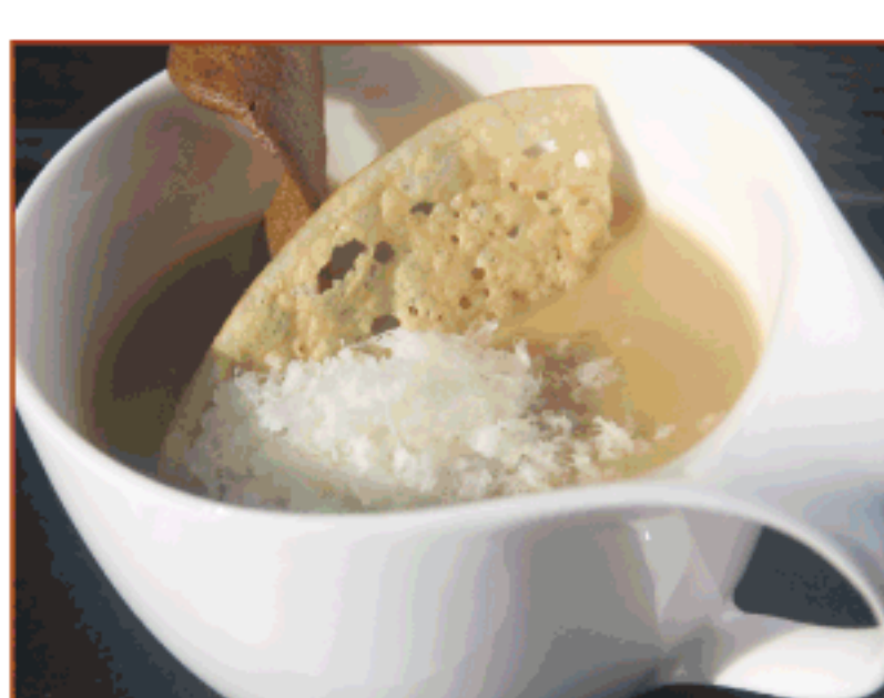
Crema suau de sopa de ceba amb fajol i formatge Serrat d'Ovella Sant Miquel