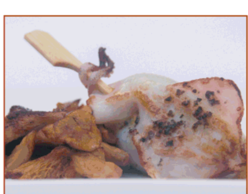
Calamarsets farcits de verdures i rossinyols amb oli d'olives negres Ca la Matilde