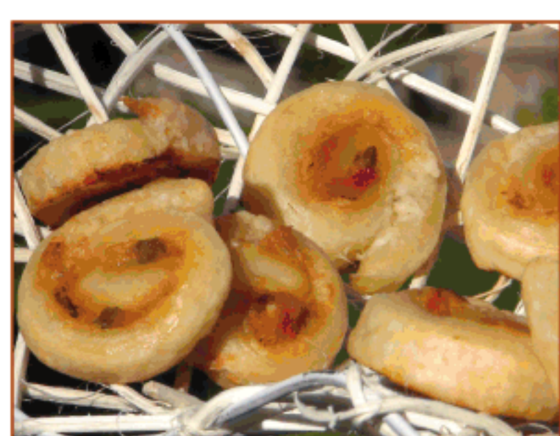
Brioix de fajol amb samfaina i formatge de cabra La Torre del Tilers