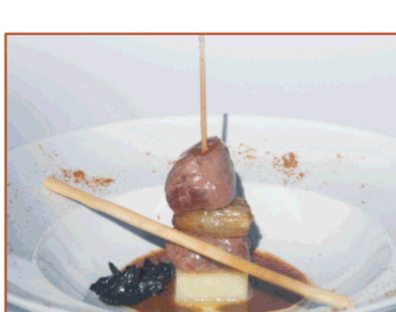
Filet de xai al forn amb patata i ceba confitada, salseta d'escarlots i carquinyolis Oliveras