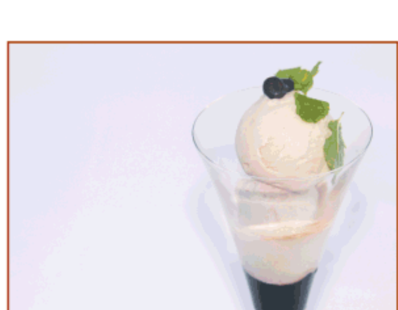
El Garrotxí (gelat de cafè i caramel de ratafia) Cúria Reial

Els vins i caves oficials de la 26a Mostra Gastronòmica de la Garrotxa: Vi Sinols blanc 2009 · Vi Sinols Antima 2004 DO Empordà Celler Empordàlia de Vins i Olis · Oli de Pau d'Empordàlia Aigües Font Vella Celler Trobat Brut Nature - Bodegas Trobat Cafès Callís · Ratafia Russet · Sinols Garnatxa Pa artesà cuït als Forns de pa de llenya de la Garrotxa Plat commemoratiu 26a Mostra Gastronòmica gentilesa de Suministres Girona