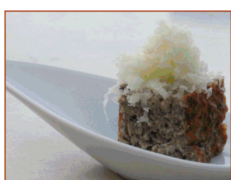
Royal de bolets de tardor amb serrat d'ovella del Mas Farró La Curenya