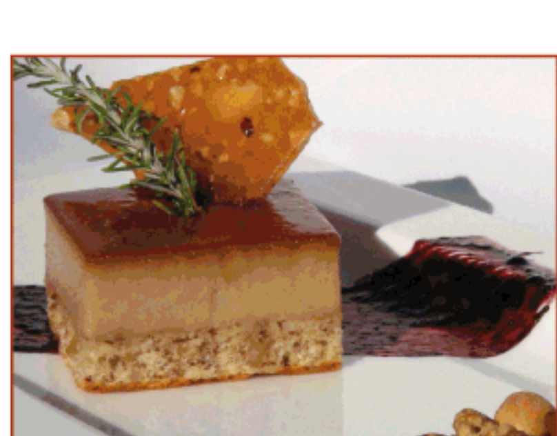
Flam de ratafia amb pa de pessic de fruits secs i melmelada de saüc Can Morera