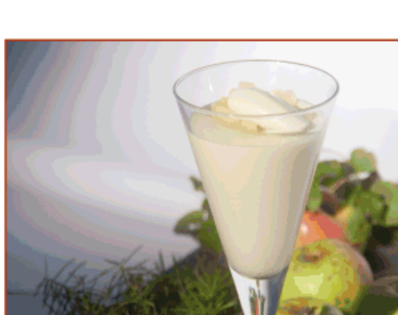
Mousse de poma Eugènia amb aranja i gelat d'herbes aromàtiques L'Hostalet